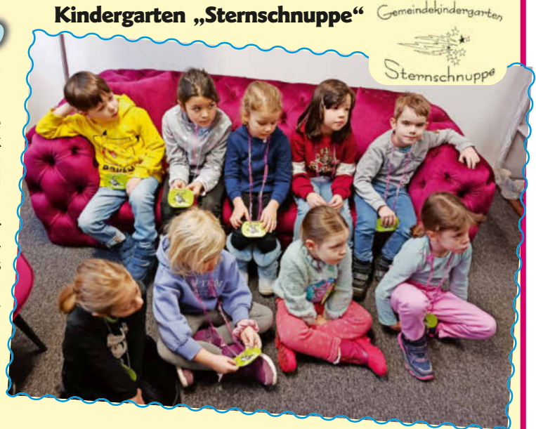
Kindergarten Sternschnuppe mit allen Vorschulkindern

Vielen Dank auch hierfür und an das gesamte, tolle Bibliotheksteam Essingen.