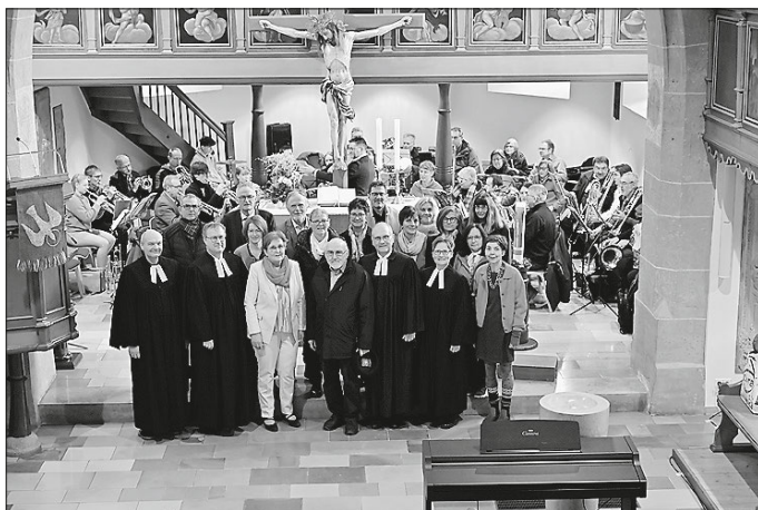
Unser neuer Kirchengemeinderat Essingen-Lauterburg mit Pfarrern und Dekanen