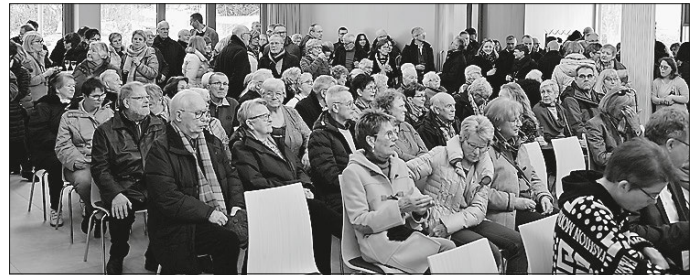
Der Saal unseres neuen Gemeindehauses war bei der Einweihung voll besetzt.