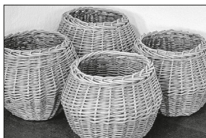
Caritas-Fastenopfer 12. und 13. März 2022

9.00 Uhr Familiengottesdienst mit den Erstkommunionkindern (Dewangen) 10.30 Uhr heilige Messe (Fachsenfeld) Kollekte: Caritas-Fastenopfer