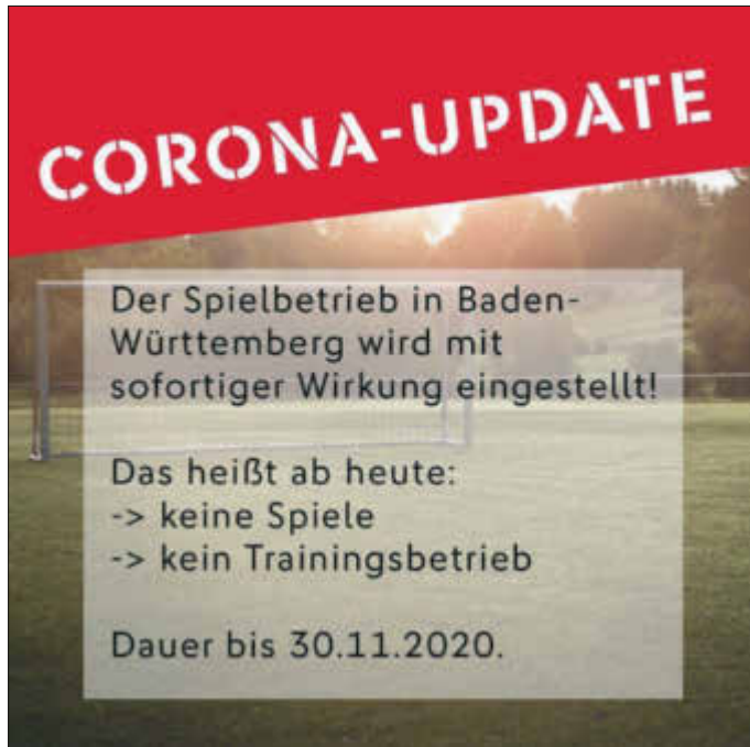
Amateurfußball wird ausgesetzt. Entscheidung vom 29.10.2020

Auch der Amateurfußball ist jetzt wieder wegen der Corona-Pandemie zum Erliegen gekommen. Wie am 29.10.2020 vom Württembergischen Fußballverband verkündet wurde, findet zunächst bis Ende November kein Trainings- und Spielbetrieb bei Jugend und Aktiven im Amateurbereich statt. Die Sportanlagen sind gesperrt und wie und wann es dann weitergehen wird, werden sicherlich erst die nächsten Wochen zeigen. Für weitere Entscheidungen der Bundesregierung und den Sportverbänden werden die Fallzahlen und der Verlauf des Covid-19 Virus erheblich dazu beitragen. Die Fußballabteilung wünscht ein baldiges Wiedersehen auf dem Sportplatz und bleibt alle gesund.