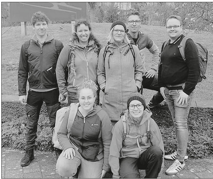
Anwärter bei der Grundlagenprüfung

Der Jahresbeitrag wurde durch die Versammlung auf 17 Euro erhöht.