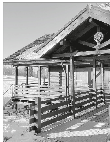
Bergrettungs wache Lauterburg im Winter